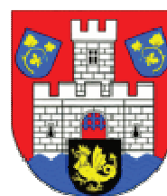
Benátky nad Jizerou